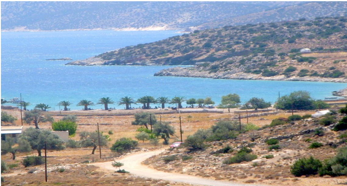
LA SPIAGGIA DELLE PALME A PANORMO

La spiaggia delle palme...molto particolare....qui la strada finisce con un pezzo di sterrato. In fondo c'è un grande parcheggio ma non è molto pianeggiante e direi che è difficile fermarsi a dormire. Da Moutsouna ci sono circa 20 km.