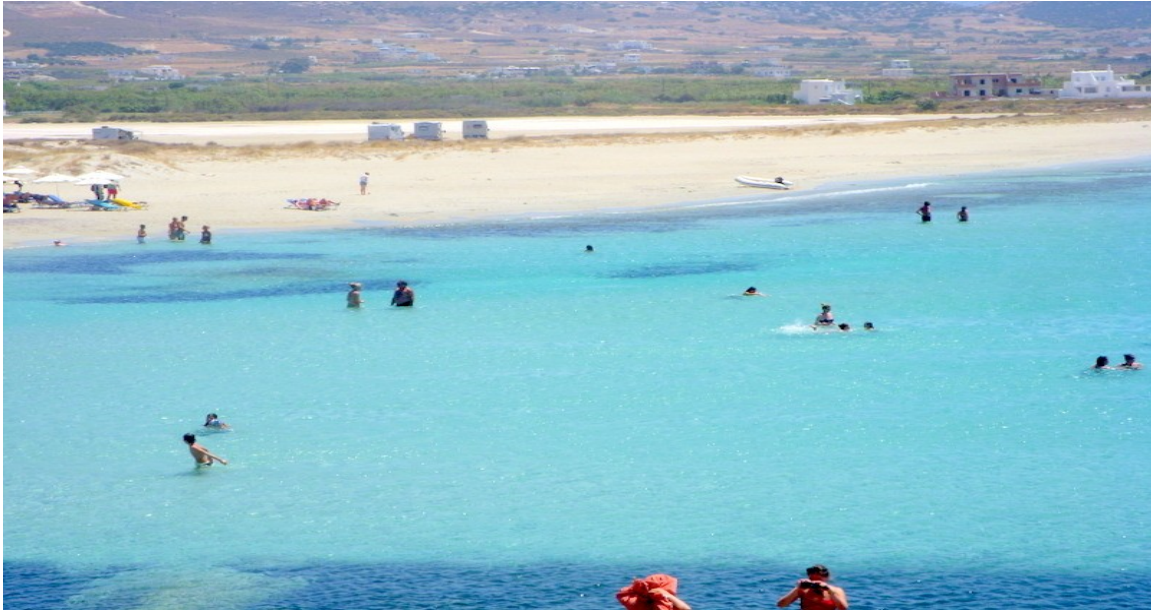
I CAMPER IN SOSTA A MIKRI VIGLA

Le spiagge della zona le abbiamo fatte tutte con il nostro fedele scooter....cerco di sintetizzare le possibili soste: