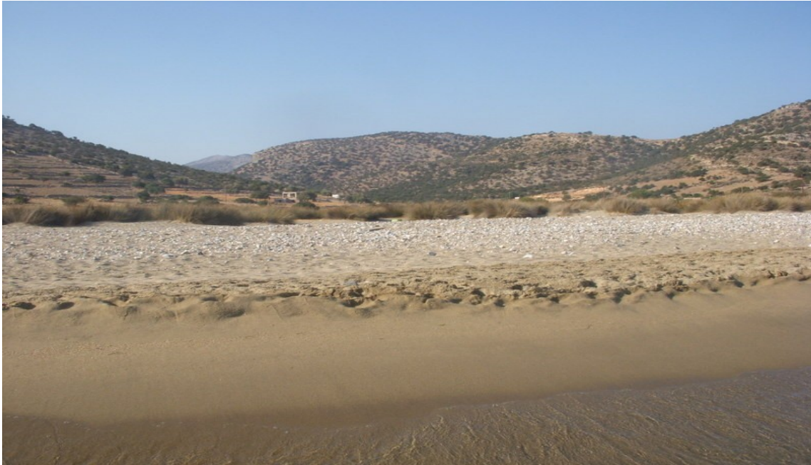
LA SPIAGGIA DI KALADOS

Dopo 25 km di strada che sale fino a 1000 metri per poi ridiscendere al mare (nelle isole greche per andare al mare si passa sempre dalla montagna) c'è questo posto sperduto dove c'è una bella spiaggia con acqua molto bassa, un piccolo porto, una laguna melmosa alle spalle della spiaggia (probabilmente molte zanzare) e una taverna, nel porticciolo c'è acqua ed elettricità. E' molto riparata dal vento ma secondo il mio punto di vista non vale la pena affrontare quella strada...ci sono posti migliori