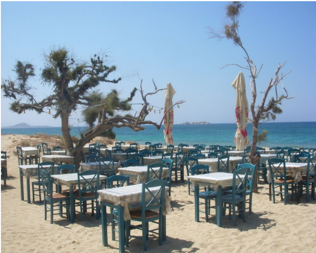
TAVERNA PARADISO A PLAKA(piu in spiaggia di cosi...)

AGIA ANNA-PLAKA e KARADES BAY offrono lo stesso paesaggio di Agio Prokopios ma sono più turistiche. A la plaka ci sono delle zone riservate ai naturisti ed il mare è sempre bello. Parcheggio lungo la strada: qui la zona è meno ventilata.