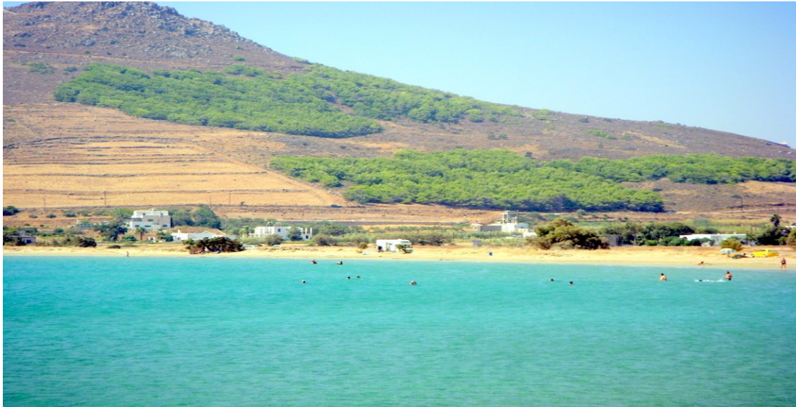
IN LIBERA A MOLOS

Lunghe spiagge bel mare poca gente si può stare tranquillamente in libera in riva al mare non ci sono wc chimici ne acqua, ma tanta tranquillità e un bellissimo panorama. La strada per arrivare è sterrata ma in ottime condizioni.