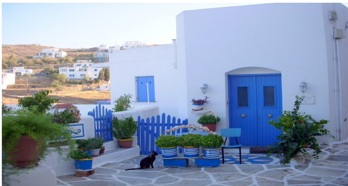
FA PROPRIO CICLADI